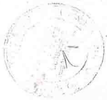
PHOTO COPY ATTESTED [Signature] (RAJ PATEL) Advocate, Notary Reg. No. 374/1955 MUSSOORIE (U.A.)