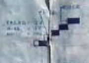
STAIR DETAIL SCALE 1/50