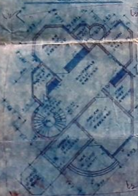
GROUND FLOOR PLAN SCALE 1/100