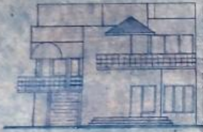
EAST FRONT ELEVATION SCALE 1/100