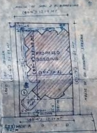
SITE PLAN SCALE 1/200

PROPOSED RESIDENCE PLAN FOR SH. J. L. KUMARIA 300, 54 SPT SITING SITUATED AT PLATNO 92/2 BEARING PART OF AREA IN NO. 20, PH JUNER, RAJENDER NAGAR, KULBAGAN TER. ESTATE, PARGANA PACHWA DEGA, DISTT. DEHRADUN