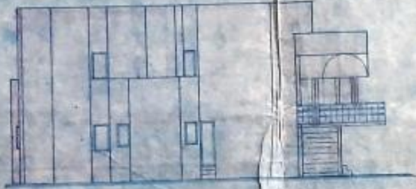
SOUTH SIDE ELEVATION SCALE 1/100