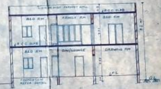
SECTION AT RE SCALE 1/100