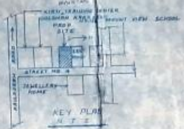
KEY PLAN N.T.S.