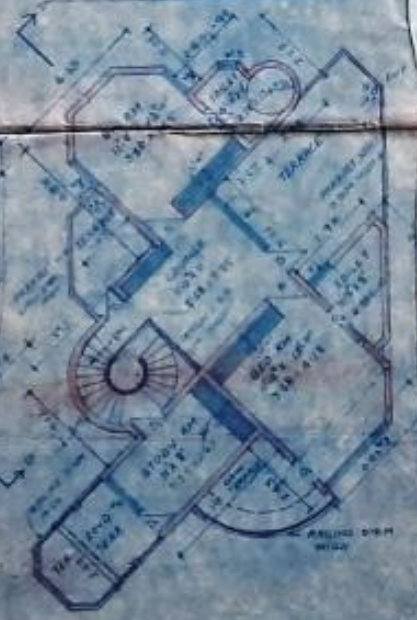
FIRST FLOOR PLAN SCALE 1/100