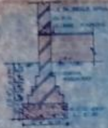
FOUND DETAIL SCALE 1/5