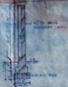
BOUNDARY WALL DETAIL SCALE 1/25