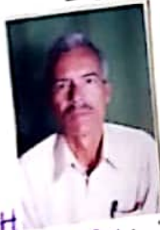
डेवा प्रयाग T. G.